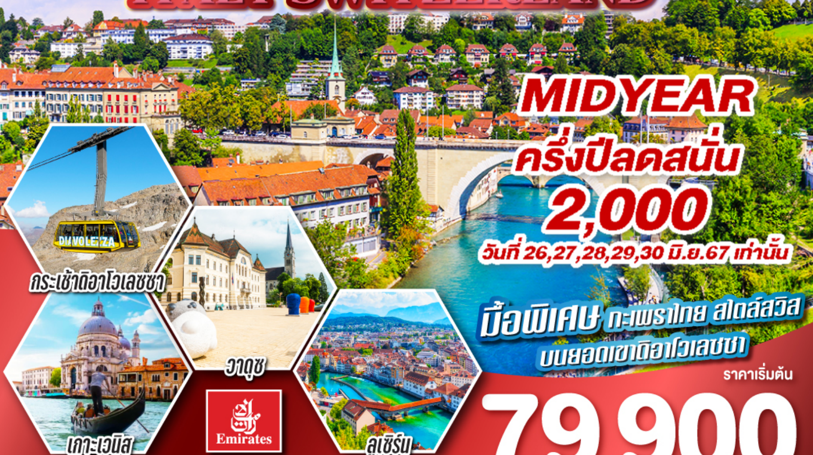
กระเช้าดีอ่าวเลสซ่า