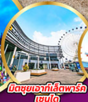
มิตซูเอากะเลียตพาร์ค เซนได