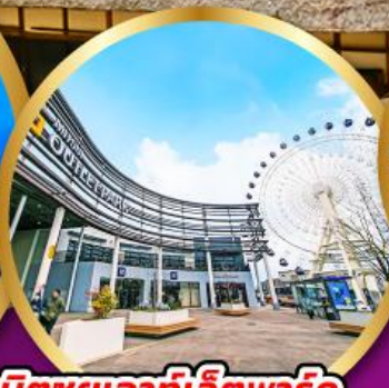
มิตซูเอากะที่เล็ดพาร์ค เซนได