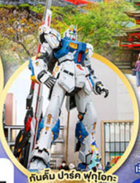
กันดั้ม ปาร์ค ฟุคุโอกะ

เดินทาง 10-14, 26-30 ก.ค. 67 08-12 ส.ค. 67 28 ส.ค.-01 ก.ย. 67