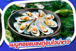
เมนูหอยแมลงภู่อูบไวน์ขาว