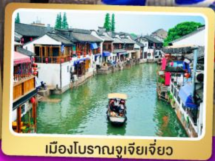
เมืองโบราณจูเจียเจี๋ย