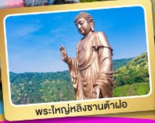
พระใหญ่หลิงซานต้าฝอ