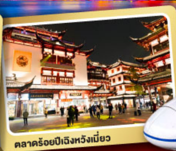
ตลาดร้อยปีเจิ้งหรงเหมียว