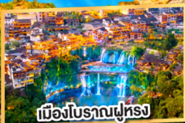
เมืองโบราณฟูหรง