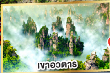
เขาวงตาร