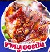
ขาหมูเยอรมัน