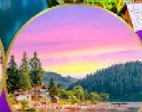
ทิกเก็ท ปาด้า