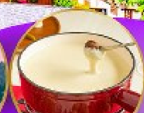
ฟองดูชีส