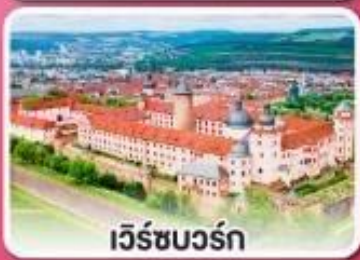
เว็ร์ชบวร์ค

เที่ยวเก็บครบเส้นทาง สายโรแมนติก เยอรมัน จากเว็ร์ชบวร์คสู่เอาคส์บวร์ค