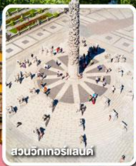
สวนวิกทอร์แลนด์