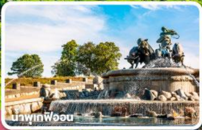
นาฬิกาฟ็อน