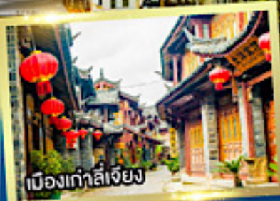
เมืองเก่าลี่เจียง