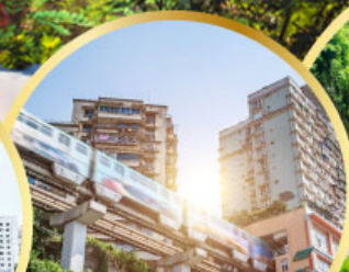
รถไฟฟ้าทะลุคิก