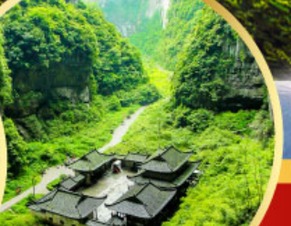
หลุมฟ้าสะพานสวรรค์