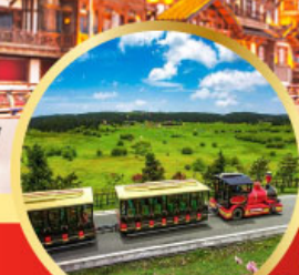
อุทยานเขานางฟ้า