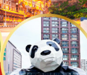
หมีแพนด้าป็นตึก