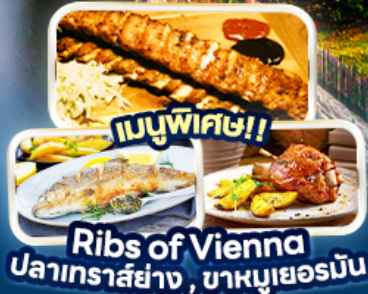
เมนูพิเศษ! Rib's of Vienna ปลาเทราสย่าง, บาหมูเยอรมัน