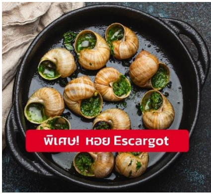
พิเศษ! หอย Escargot

🍴 รับประทานอาหารเย็น (มื้อที่13) เมนูพิเศษ!! หอย Escargot