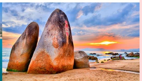
วนอุทยานสุดขอบฟ้า

*ทางบริษัทฯ ขอสงวนสิทธิ์ในการสลับโปรแกรมทัวร์ตามความเหมาะสมขึ้นอยู่กับสถานการณ์หน้างาน โดยคำนึงถึงผลประโยชน์ของลูกค้าเป็นสำคัญ