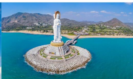
เจ้าแม่กวนอิมหนานชาน