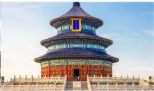
หอสังเกตการณ์ฟ้าเทียนถาน