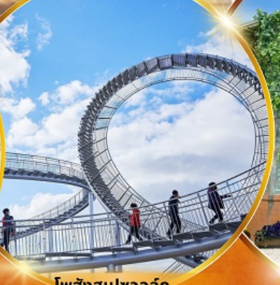
โพฮังสเปซวอล์ค