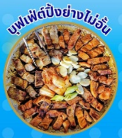
บุฟเฟ่ต์ปิ้งย่างไม่อื่น