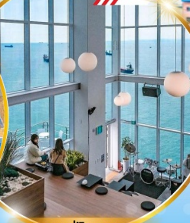
คาเฟ่วิวทะเล

ถ่ายรูปชิคๆ หมู่บ้านวัฒนธรรมคิมซอน ใหม่ล่าสุด คาเฟ่ริมทะเล วิวหลักล้าน ขึ้นเคเบิลคาร์ ชมทะเลปูซาน ห้ามพลาด!! ตลาดปลาที่ใหญ่ที่สุด ชิมของอร่อยที่ตลาดแฮนแด ช้อปปิ้งตลาดพื้นเมือง แหล่งช้อปปิ้งใต้ดิน ซัมซอน อิสระช้อปปิ้ง Lotte Duty Free