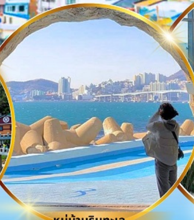
หมู่บ้านริมทะเล