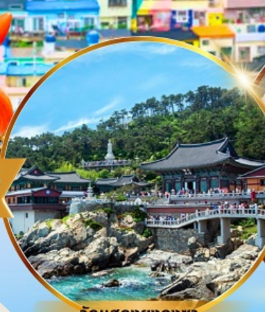
วัดแฮดงยงกุงซา