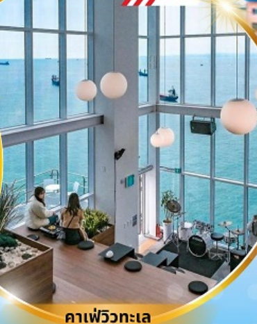
คาเฟ่วิวทะเล

ถ่ายรูปชิคๆ หมู่บ้านวัฒนธรรมคิมซอน ใหม่ล่าสุด คาเฟ่ริมทะเล วิวหลักล้าน ขึ้นเคเบิลคาร์ ชมทะเลปูซาน ห้ามพลาด!! ตลาดปลาที่ใหญ่ที่สุด ชิมของอร่อยที่ตลาดแฮนแด ช้อปปิ้งตลาดพื้นเมือง แหล่งช้อปปิ้งใต้ดิน ซัมซอน อิสระช้อปปิ้ง Lotte Duty Free