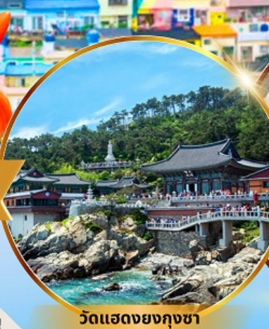
วัดแฮดงยงกุงซา