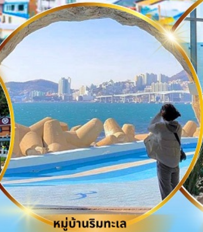
หมู่บ้านริมทะเล