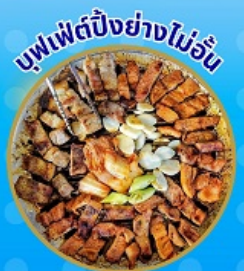
บุฟเฟ่ต์ปิ้งย่างไม่อื่น