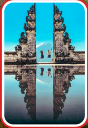
ไฮไลต์แห่งบาห์ลี