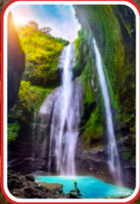
ชมความงดงาม