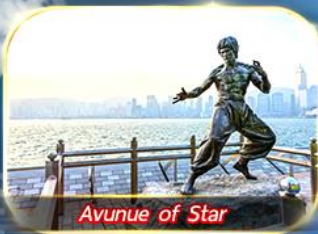
Avunue of Star