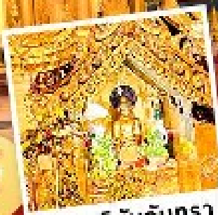
พระสุริยันจันทรา