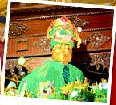
ขอพรแม่ยักยี