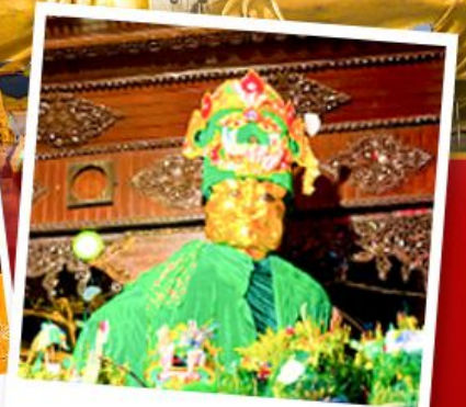
ขอพรแม่ยักษ์