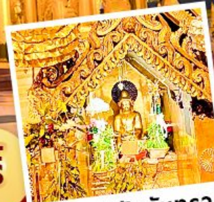
พระสุริยันจันทร