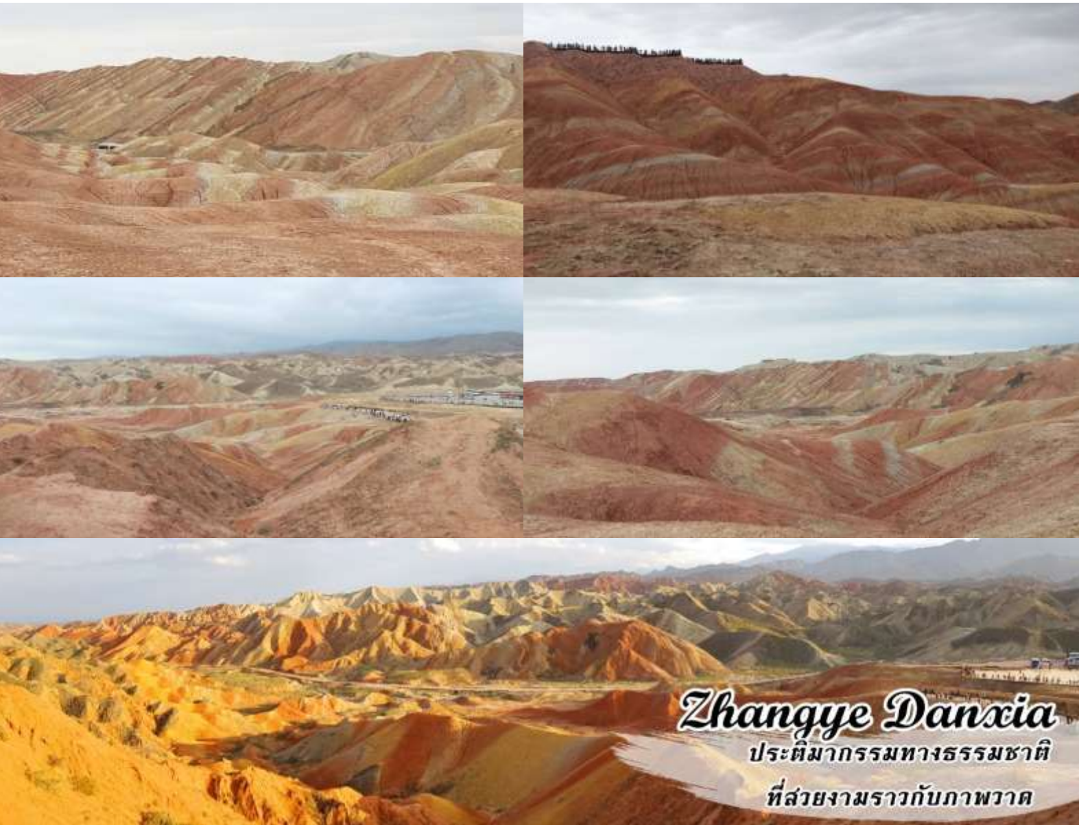
Zhangye Danxia ปรากฏการณ์ทางธรรมชาติ ที่สวยงามราวกับภาพวาด