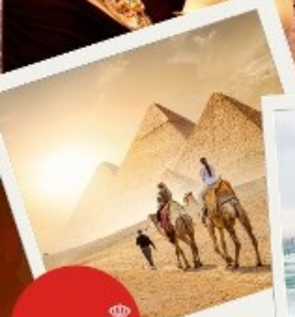
มหาปิรามิด