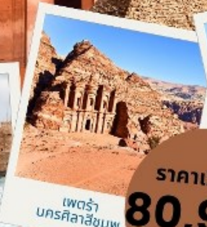
เพตรา บคริสลาซีมพู