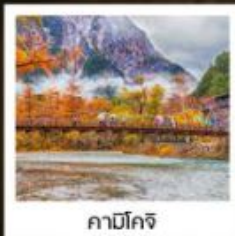
คามิโคจิ

ลิ้มรสเมนูสุดพิเศษ บุฟเฟ่ต์ซาซิมิอื่น ๆ / ซาซิมิระดับพรีเมียม