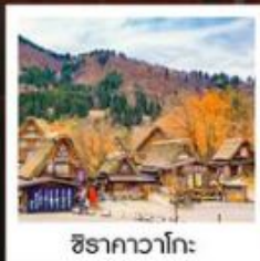
ชิราคาวาโกะ