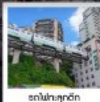
ต่าฟ้าทุกตัก

ทัวร์คุณภาพ ไปล้งร้านช้อปมั้ง • ไปชยออเฟชััน