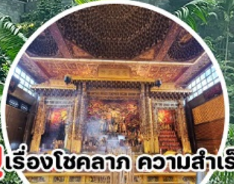
บู เรื่องโชคลาภ ความสำเร็จ Loyang Tua Pek Kong Temple