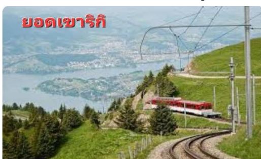
ยอดเขาริกิ

นำท่านเดินทางสู่ เมืองเวกกีส์ (WEGGIS) (136 กม.) เมืองน่ารักริมทะเลสาบลูเซิร์นเป็นเมืองเล็กๆ ที่มีความเป็น