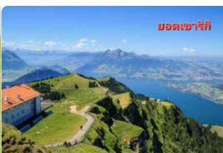
ยอดเขาริกิ

ธรรมชาติ อากาศดี...แล้วนำท่านนั่งรถ ไต่เขา RIGI ถือเป็นรถไฟไต่เขาที่เก่าแก่ ที่สุดในยุโรป จากความสูงจาก