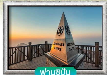
ฟานชีปัน