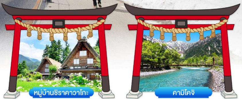
หมู่บ้านชิราคาวาโกะ