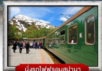
นั่งรถไฟพร้อมสเปานา

พิเศษ! พักบนเรือสำราญ แบบ Window Room 2 คืน, พักบ้านแซนต้าคลอส