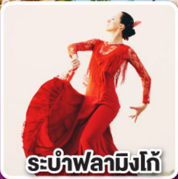
ระบำฟลามิงโก

ล่องเรือชมความน่ารัก ตามธรรมชาติของฝูงโลมา