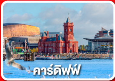
คาร์ดิฟฟ์