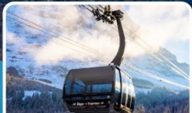
กระเช้า ไอเกอร์เอ็กสเพรส สู้จุงเฟรา

อิตาลี สวิตเซอร์แลนด์ ฝรั่งเศส 10 วัน 7 คืน