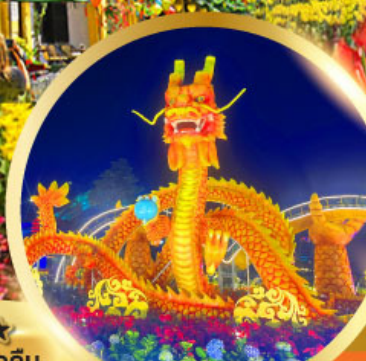
สะพานมังกรพันไฟ

เมนูพิเศษ! กุ้งมังกรซอสเนย + หม้อไฟ ทะเล SEAFOOD 1 มื้อ บึงย่าง ซาบู 1 มื้อ