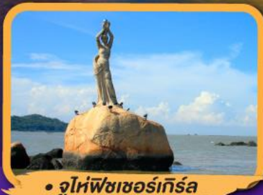
• จูไห่ฟิชเชอร์เก็ท