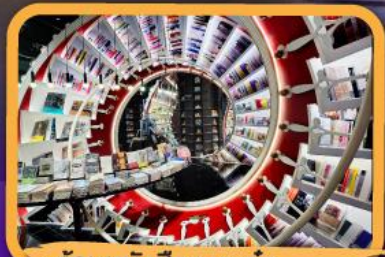
• ร้านหนังสือจุงชูก่อ