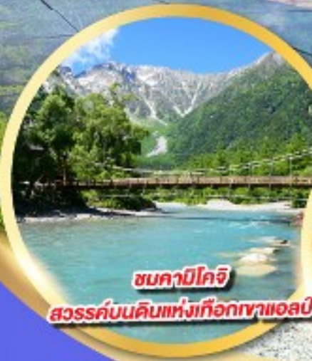
ชมคาบิโกจิ

นั่งกระเช้าลอยฟ้า 2 ชั้น ชินโฮทากะ หนึ่งเดียวในญี่ปุ่น แลนด์มาร์กยอดฮิตของโอคุซึดะ