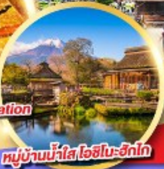
หมู่บ้านน้ำใส โอชิโนะฮัทสึ