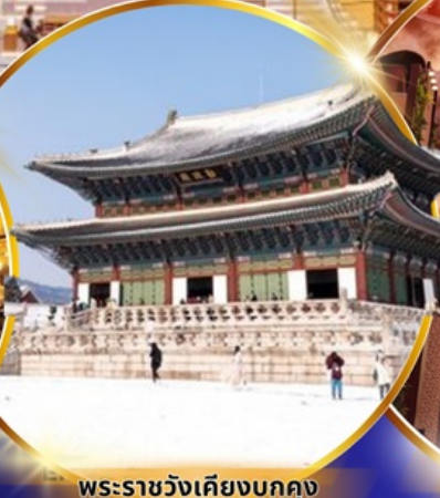
พระราชวังเคียงบกคุง