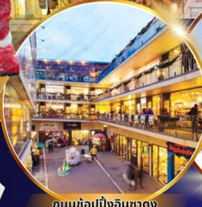
ถนนช้อปปิ้งอินชาง