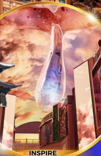
INSPIRE Entertainment Resort

ใหม่!! ห้องสมุดสุดอลังการที่ชวอน ชมจอ LED เสมือนจริงขนาดยักษ์ สนุกสุดมันส์ที่สวนสนุกเอเวอร์แลนด์ ชมพระราชวังเคียงบอกคุง ถนนวัฒนธรรมอินชาง อิสระช้อปปิ้งคังนัม เมืองดง Lotte Duty Free