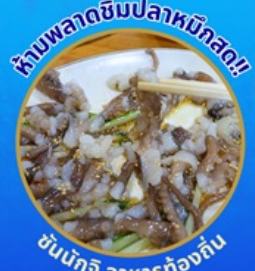
ห้ามพลาดชิมปลาหมึกสด!

โพล้งสเปซวอล์ค สกายวอร์ค ตามรอยซีรีส์ Hometown chachacha ถ่ายรูปชิคๆ หมู่บ้านวัฒนธรรมคัมซอน ขึ้นเคเบิลคาร์ ชมทะเลปูซาน นั่งรถไฟปูคปิก sky capsule ชิมของอร่อยตลาดแฮนแด อิสระช้อปปิ้ง Lotte Duty Free