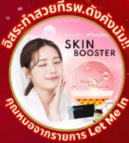
อิสระทำสวยที่พ.ดังคังนัม!! SKIN BOOSTER คุณงามความดี Let Me In

ชมจอ LED ขนาดยักษ์ที่รีสอร์ท 5 ดาว ใหญ่ที่สุดในเอเชียเหนือ ชมพระราชวังคยองบกกุง ย่านอนดัตหมู่บ้านบุคซอน ฮงอก ใส่ชุดฮันบก ทำข้าวห่อสาหร่าย อิสระช้อปปิ้ง Lotte Duty Free