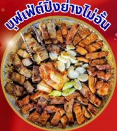
บุฟเฟ่ต์ปิ้งย่างไม่วัน