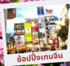
ช้อปปิ้งเทนจิน