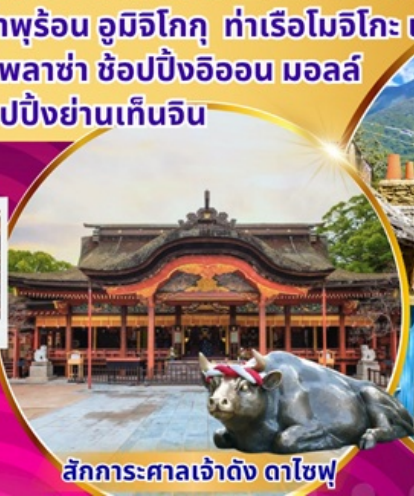
สักการะศาลเจ้าดัง ดาไซฟู