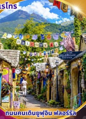
ถนนคนเดินยูฟูอิน ฟลอร์ริล

พักโรงแรม 3 ดาว ★★ ★ ฟรี ประกันอุบัติเหตุ บริการอาหารท้องถิ่น