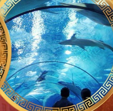
เซี่ยงไฮ้ไอเซียนอะควาเรียม