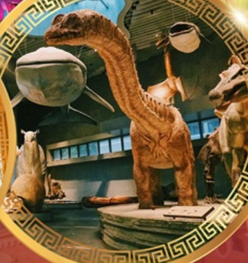
พิพิธภัณฑ์ธรรมชาติเซี่ยงไฮ้