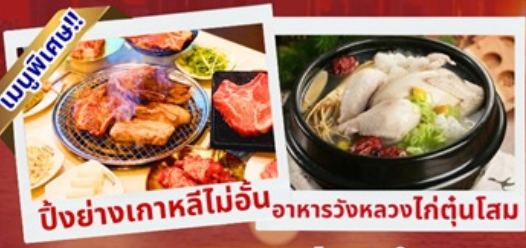
ปิ้งย่างเกาหลีไม่อื่น อาหารวังหลวงไก่ตุ๋นโสม