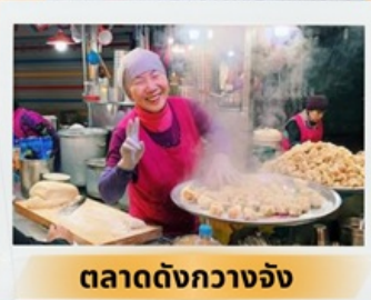
ตลาดดังกวางจ้ง