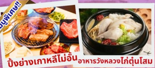
ปิ้งย่างเกาหลีไม่อื่น อาหารวังหลวงไก่ตุ๋นโสม