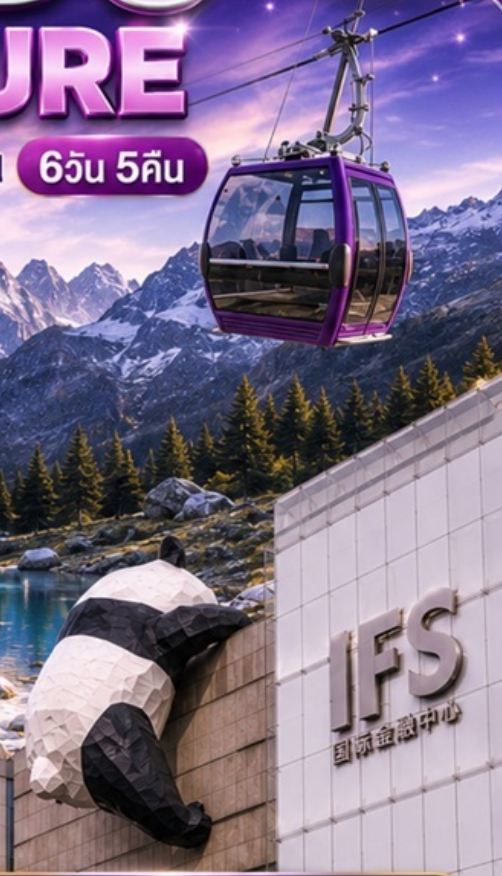
อุทยานสี่ดรุณี (รวมรถอุทยาน)

ชอยกว้างชอยแคบ ตึก IFS แพนด้ายักษ์ป็นตึก - ถนนคนเดินชุนซีลู่ วัดต้าฉือ - ถนนคนเดินไต้กู่หลี่ - ร้านPopmart - ถนนคนเดินตงเจียวจื่อ