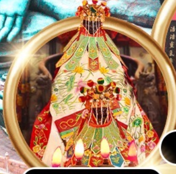
ยืมเงินเจ้าแม่กวนอิมสองฮ่า