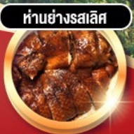
ห่านย่างรสสิส