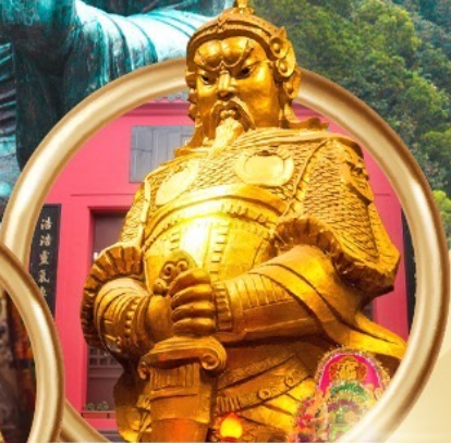
วัดแซกทงหมีว