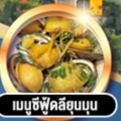
เมนูซีฟู้ดลิขุนบน