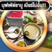
บุฟเฟ่ต์ชาบู เมื่อก่อน!!