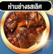
ทำอย่างรสเลิศ