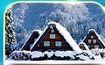
ชมงานประดับไฟนาบามา โนะ ซาโตะ